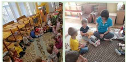
Утро радостных встреч